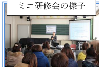
ミニ研修会の様子

3月に入り、どの学年もまとめの時期に入ります。6年生は中学校生活への希望を胸に、卒業式に向けて練習を始め、校長先生との給食会食や奉仕活動に取り組みます。1年生から5年生も6年生への感謝とお祝いの気持ちを表そうと6年生を送る会の準備をし、同時に進級に向けて学習のまとめをしています。また、杉の子児童会でも復興プロジェクトの一環として今までお世話になった学生ボランティアの方への感謝の会を3月10日に行う予定です。残り3週間ですが、どの学年も中野小で学んだことを誇りに思えるように、一日一日を大切にしながら充実した学校生活を送れるようにしていきたいと思しますので、今後とも皆様のご理解とご協力をお願いいたします。